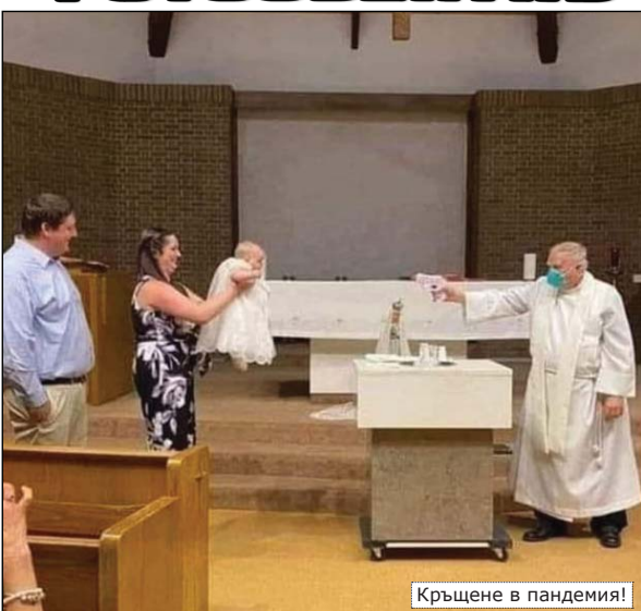
Кръщение в пандемия!

Ако желаете да публикувате и Ваши интересни фотографии, моля изпращайте материалите си на адрес: Сатовча 2950, ул. „Тодор Шопов“ №37, факс: 07541/20-95, e-mail: satovchabl@abv.bg